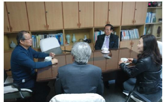
11월 5일 에이스메디컬에서 방문