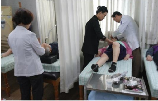
11월 5일 파주 범죄피해자지원센터 침술봉사