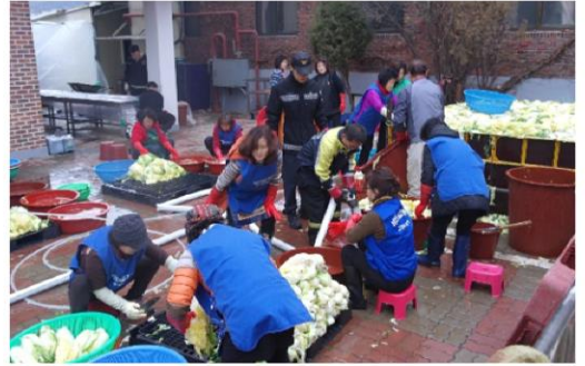
11월 23~24일 지역주민과 함께하는 김장