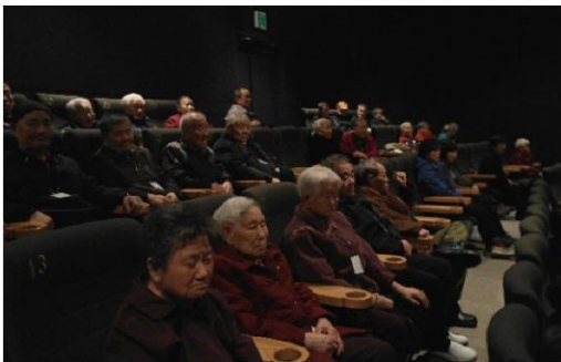
12월 2일 명필름아트센터에서 애니메이션 '마당을 나온 암탉' 관람