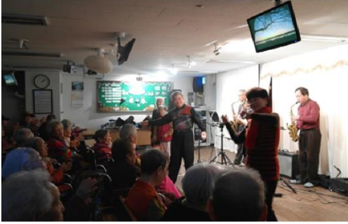
1월 24일 덕양구청 섹소폰동호회 위문공연