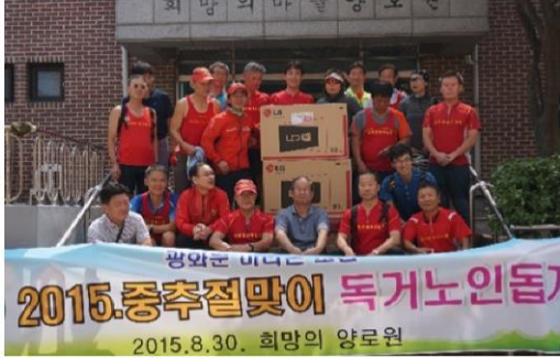
8월 30일 광학문 마라톤 모임 방문