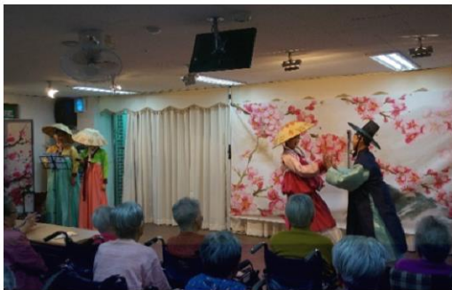
10월 14일 노래극 ‘폭소방자전’ 공연 관람