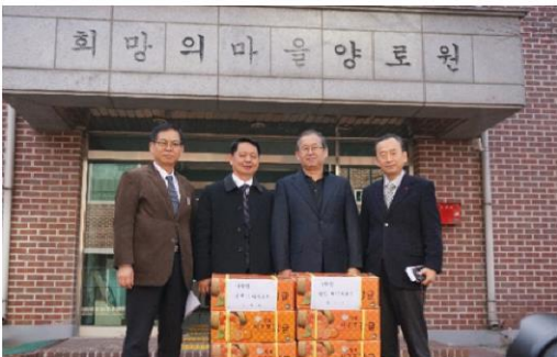
12월 23일 경기도 행정2부지사님 방문