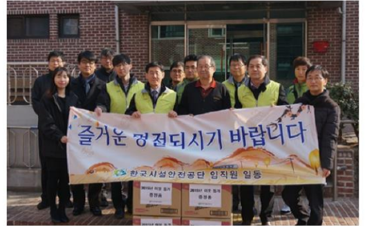
2월 5일 한국시설안전 관리공단 방문