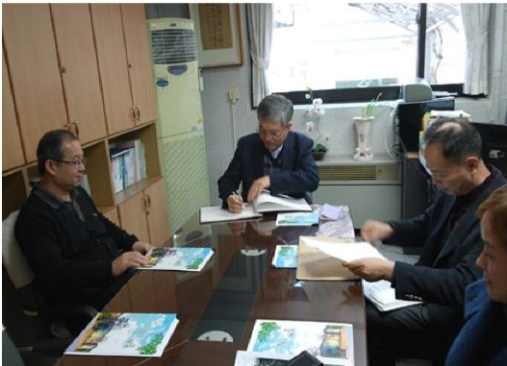
2월 11일 덕양구청장님 방문