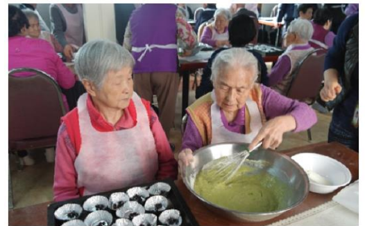
12월 7일 녹차머핀만들기 체험활동