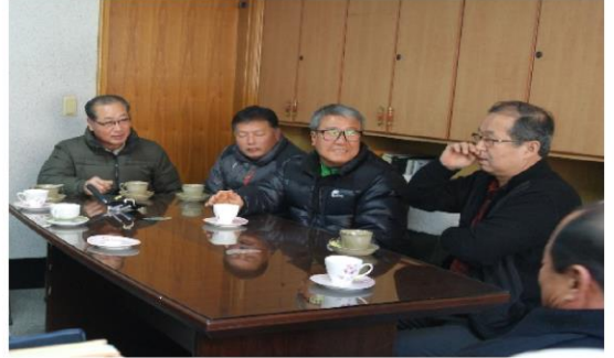
12월 19일 서울시교육청 동우회 방문