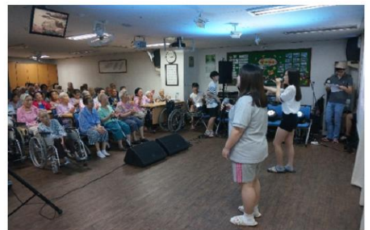
7월 29일 청소년동아리와 함게하는 "나눔사랑음악회"