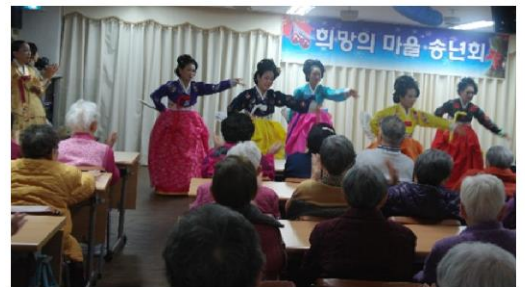
12월 23일 송년회