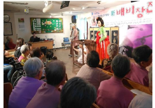
4월 30일 신배비장전 관람