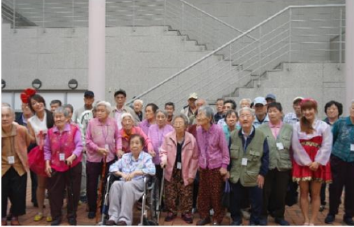
5월 7일 마당놀이 '뽕덕이뿔났다' 관람