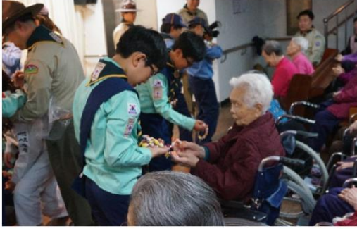
12월 12일 행주산성 스카우트단원 방문