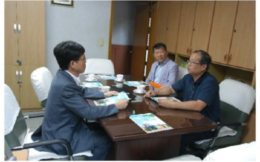
9월 23일 고양시 부시장님 방문