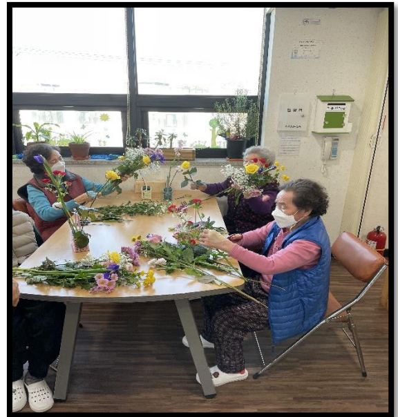
원예활동 - 꽃꽂이